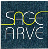
Schéma d'Aménagement de Gestion des Eaux du bassin de l'Arve