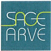
Schéma d'Aménagement de Gestion des Eaux du bassin de l'Arve