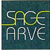
Schéma d'Aménagement de Gestion des Eaux du bassin de l'Arve