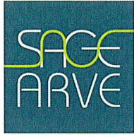
Schéma d'Aménagement de Gestion des Eaux du bassin de l'Arve

Président de la Commission locale de l'eau du bassin de l'Arve Président du Comité de Bassin Rhône Méditerranée