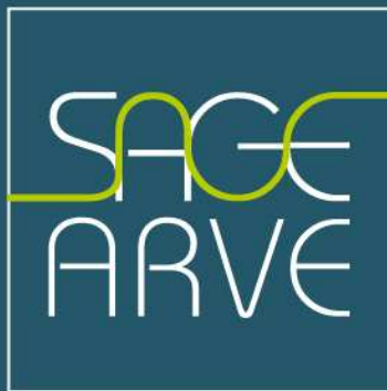
Schéma d'Aménagement de Gestion des Eaux du bassin de l'Arve

Synthèse de l'étude Version définitive Novembre 2013