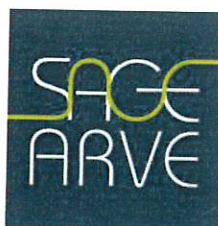
Schéma d'Aménagement de Gestion des Eaux du bassin de l'Arve

SAGE ARVE - SM3A - 300 Chemin des Prés Moulin - 74800 Saint-Pierre-en-Faucigny Tél. : 04 50 25 60 14 - Fax : 04 50 25 67 30 - sm3a@riviere-arve