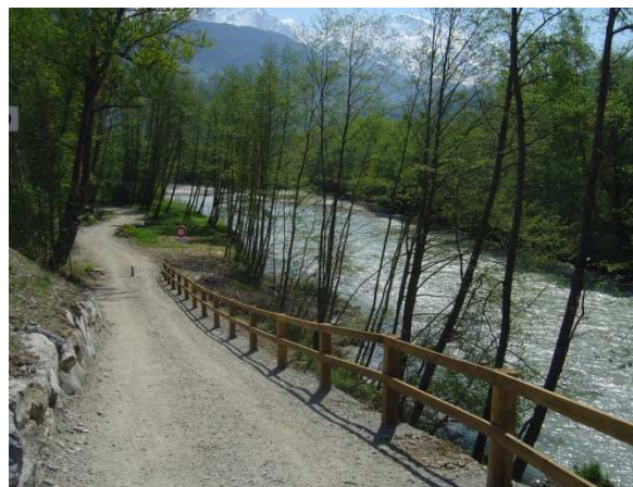
Photo 16 : Cheminement en bord d'Arve à Passy réalisé par le SM3A