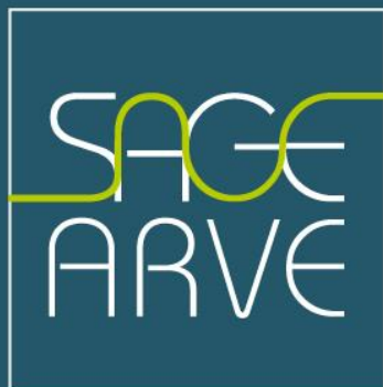
Schéma d'Aménagement de Gestion des Eaux du bassin de l'Arve