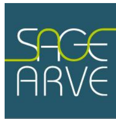
Schéma d'Aménagement de Gestion des Eaux du bassin de l'Arve

SAGE ARVE - SM3A - 300 Chemin des Prés Moulin - 74800 Saint-Pierre-en-Faucigny Tél. : 04 50 25 60 14 - Fax : 04 50 25 67 30 – sage@sm3a.com