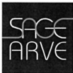
Schéma d'Aménagement de Gestion des Eaux du bassin de l'Arve